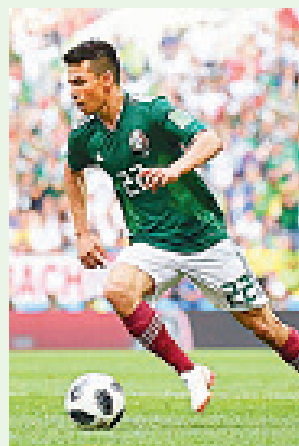
MÉXICO TOMARÁ parte en la Liga de Naciones.