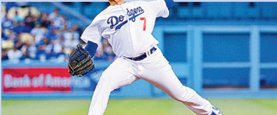
EL LANZADOR MEXICANO Julio Urías fue reactivado por Grandes Ligas y Dodgers de Los Angeles después de pasar una semana con una licencia administrativa.

Urías estuvo suspendido mientras las Grandes Ligas investigaban al zurdito mexicano por su arresto el 13 de mayo como parte de una investigación de un caso menor de violencia doméstica. La policía informó que Urías fue detenido en un estacionamiento