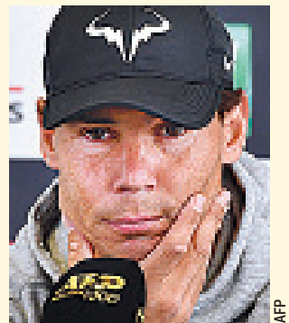
RAFAEL NADAL, a la espera de jugar.