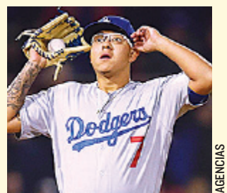
JULIO CÉSAR URÍAS, a pagar las consecuencias.