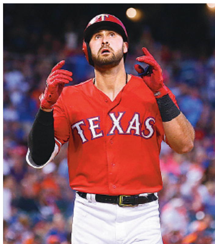
JOEY GALLO SE DISTINGUIÓ en la semana con los Rangers de Texas en la Liga Americana.

El guardabosques logró destacados números a la ofensiva a la hora de batear de .417/.533/1.417, para encabezar las Grandes Ligas en cuadrangulares, slugging, carreras impulsadas (16), carreras anotadas (nueve) y OPS (1.950).