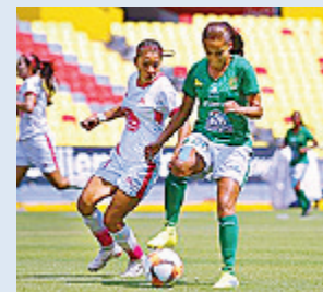
LEÓN DEJÓ sin Liguilla a las Chivas.