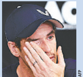
ANDY MURRAY dejará las canchas.

■ Lainez, de 18 años de edad y 1,67 metros de estatura, debutó en la máxima categoría del fútbol mexicano con apenas 16 años, ocho meses y 25 días, convirtiéndose en el jugador más joven en la historia del América en estrenarse en la Liga MX.