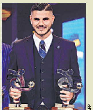
ICARDI FUE EL MÁXIMO goleador de la temporada 2017-2018.