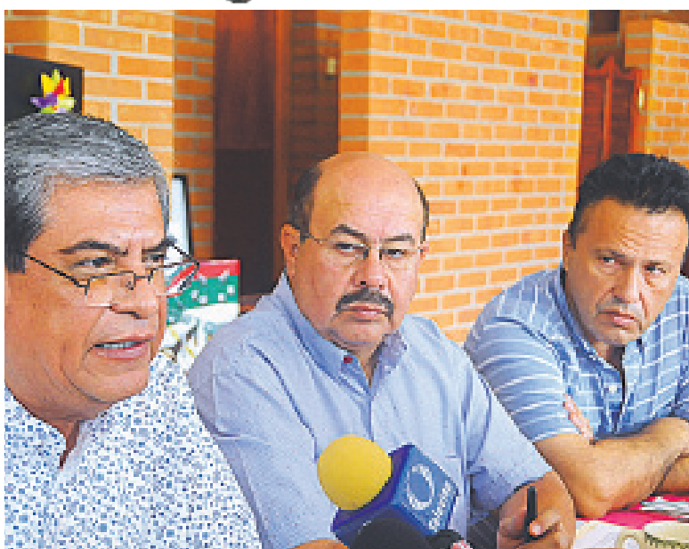
EMPRESARIOS SE INCONFORMARON por los altos cobros de energía eléctrica, por lo que solicitan una revaloración.