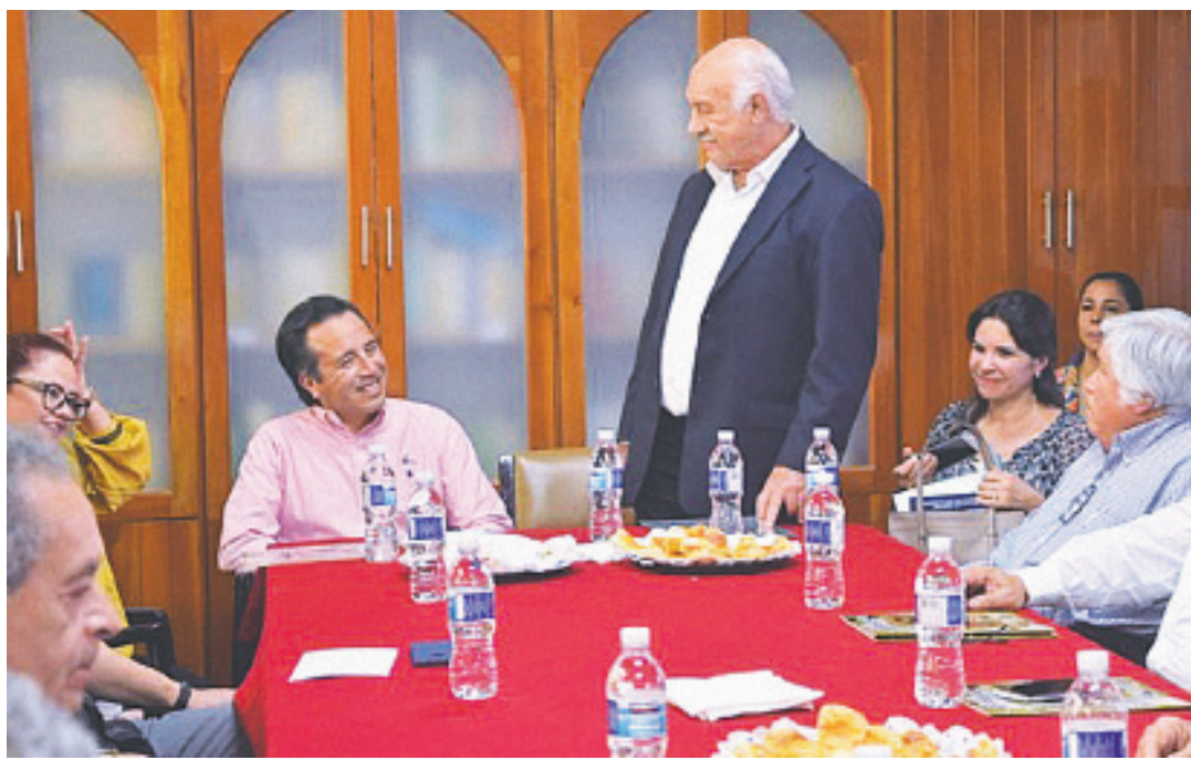
EL GOBERNADOR ELECTO, Cuitláhuac García, se reunió con el dirigente de la FESAPAUV, Enrique Levet Gorozpe.